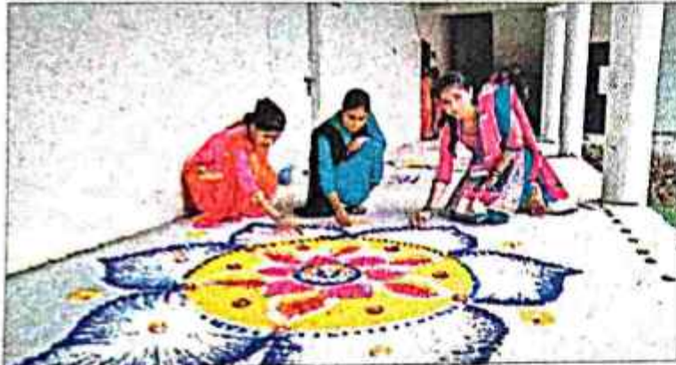
रंगोली बनाती छात्रएं.