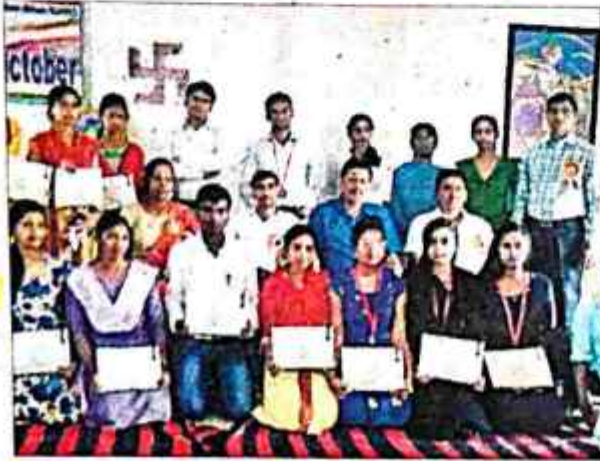
मेडल व प्रशस्ति पत्र के साथ स्टूडेंट्स.