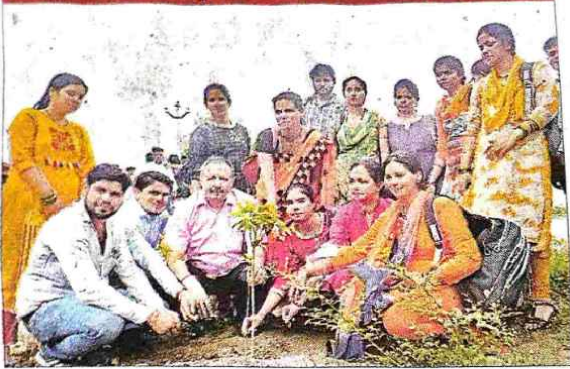
पौधा लगाते कॉलेज के अध्यक्ष एवं छात्र-छात्राएं.