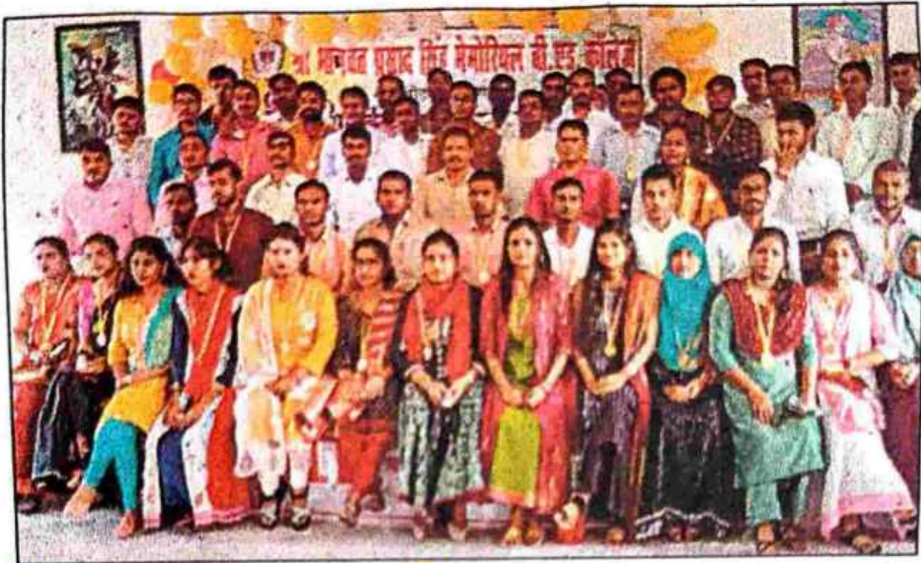
समारोह में सम्मानित किए गए शिक्षक । • हिन्दुस्तान