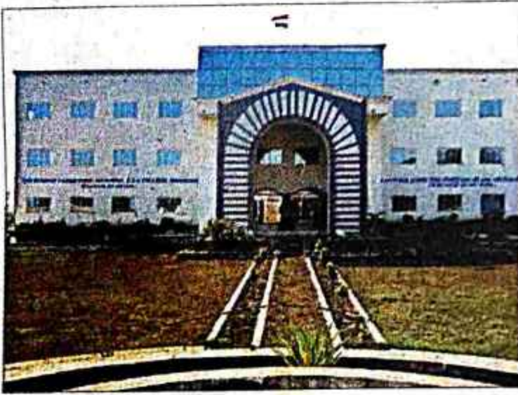
कॉलेज का भवन.