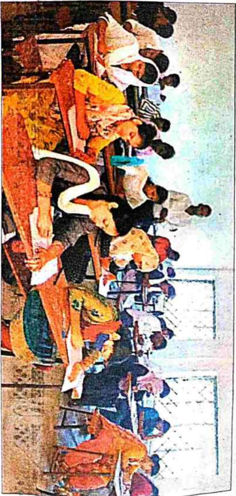
परीक्षा देते छात्र-छात्राएं.