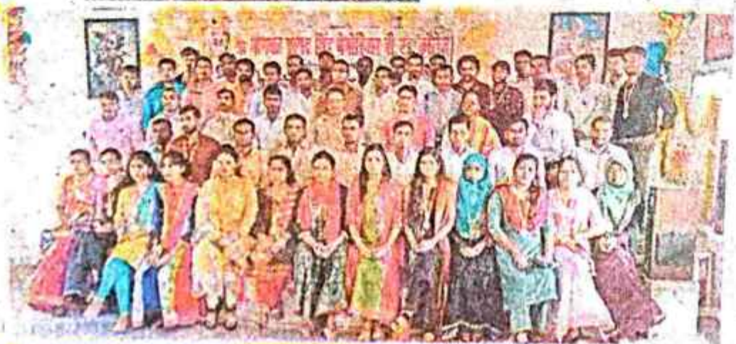
सम्मानित नवनियुक्त शिक्षकों के साथ कालेज के अध्यक्ष एवं शिक्षक।

बीते 29 अगस्त को आयोजित वाद विवाद प्रतियोगिता में पत्र व विपक्ष में प्रथम, द्वितीय व तृतीय स्थान प्राप्त करने वाले छात्रों को सम्मानित किया गया। इसमें प्रथम