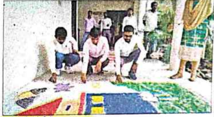
छात्रों ने भी रंगोली में आजमाया हाथ.