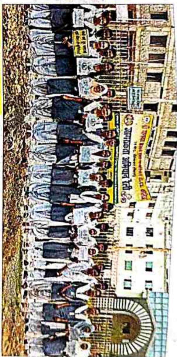
जागरूकता रैली में शामिल प्रशिक्षु.