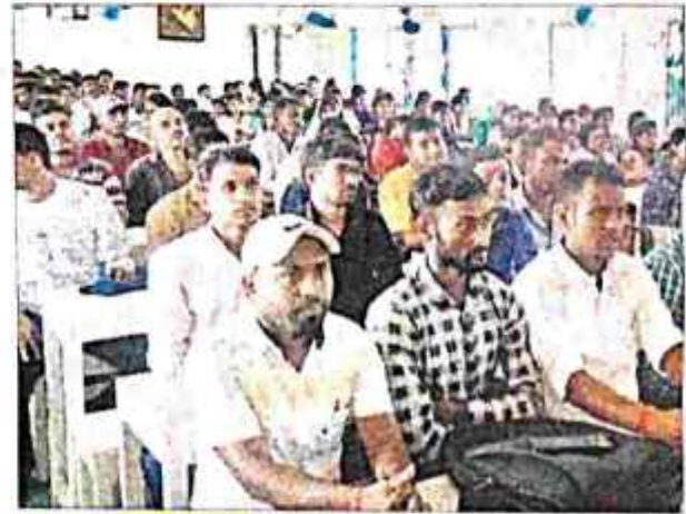
कार्यक्रम में मौजूद छात्र.