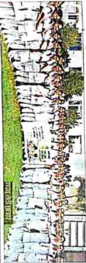
पौधारोपण करते छात्राओं ने शपथ