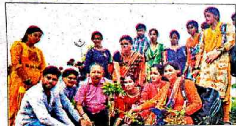
पौधारोपण करते कॉलेज के शिक्षक.