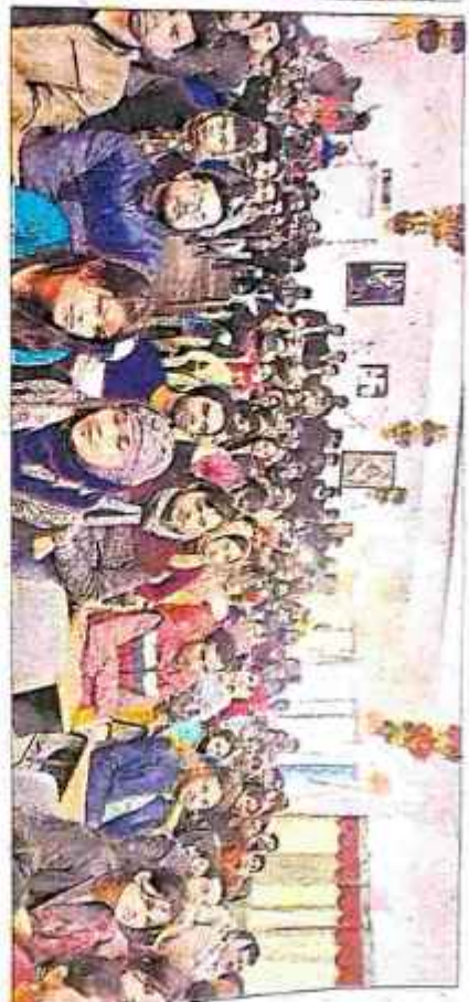
कॉलेज अध्यक्ष के साथ सम्मानित विद्यार्थी.