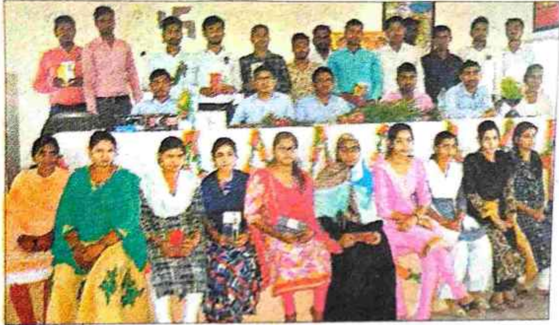
अध्यापकों के साथ सीटेट पास विद्यार्थी.