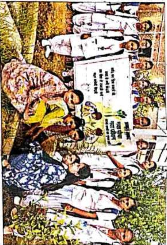
पौधे लगानी शिक्षिकाएं.