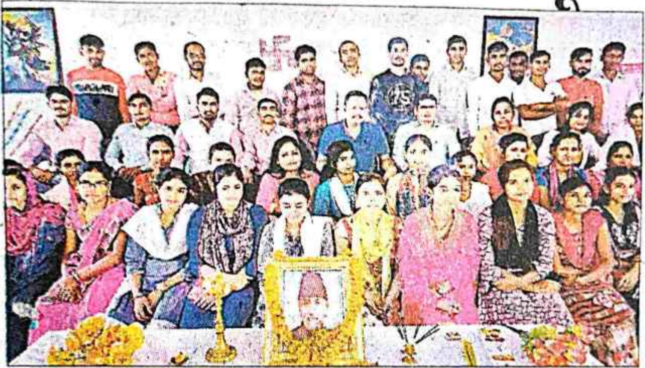
बीएड कॉलेज में आयोजित जयंती कार्यक्रम में शामिल छात्र-छात्राएं.