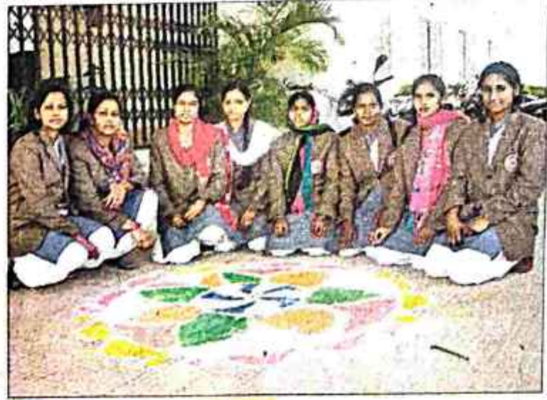
कॉलेज में परिसर में रंगोली बनाती छात्राएं.