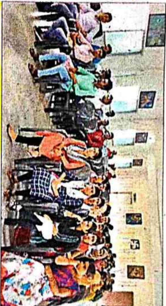
वाद विवाद प्रतियोगिता में शामिल छात्र-छात्राएं.

प्रतियोगिता में पक्ष व विपक्ष में कुल 31 प्रतिभागियों ने हिस्सा लिया. छात्राओं ने नारी को गरिमा बनाये रखने के लिए अत्याचार और शोषण के विरुद्ध खड़े रहने की बात कही. छात्राओं ने कहा कि आज महिलाएं घर, परिवार, समाज, प्रदेश व देश के उत्थान में महती भूमिका निभा रही है. नारी अब चूल्हा चौक से ऊपर उठ कर अंतरिक्ष तक पहुंच गयी है. हर क्षेत्र में लड़कियां लड़कों से बेहतर कर रही है. राजनीति व प्रशासन में वेदियां ऊंचे पदों पर आसीन हैं. आज महिलाएं पूरे ब्रह्मांड में नारी शक्ति का परचम लहहा