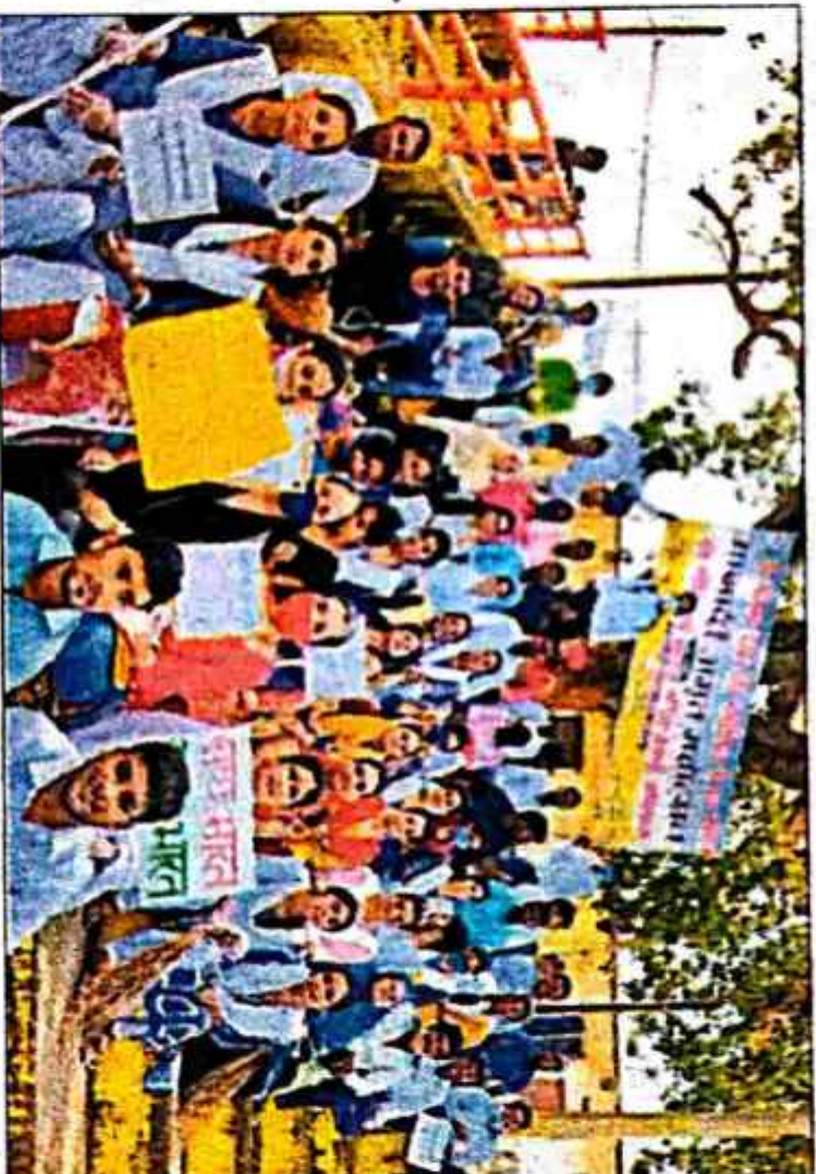
स्वच्छता अभियान चलाते कॉलेज के छात्र-छात्राएं.

गदगपुर. देव मोड़ स्थित प्रतिष्ठित संस्थान श्रीभागावत प्रसाद सिंह मेमोरियल वीएड कॉलेज के छात्र-छात्राओं ने आजारी के अमृत महोत्सव के तहत देव में स्वच्छता अभियान चलाया. छात्र-छात्राओं ने देव सूर्य मंदिर, सूर्यकुंड तालाब व पाताल गंगा परिसर की महाविद्यालय के प्रशिक्षुओं ने साफ-सफाई की. सबसे पहले प्रशिक्षुओं ने देव मंदिर परिसर की सफाई की. इसके बाद सूर्य कुंड तालाब पर पहुंच कर अभियान चलाया. सभी प्रशिक्षुओं ने कार्यक्रम प्रभारी के निर्देश पर अनुशासन में रह कर स्वच्छता अभियान चलाया. फिर सभी पाताल गंगा पहुंचे तथा सफाई की. वीएड कॉलेज के प्रशिक्षुओं ने देव में स्वच्छता का संदेश भी दिया. वहीं अन्य लोगों को